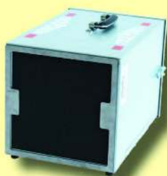
ToolPower TP 1060 Staubfänger-Luftreiniger Ventilator-Leistung: 1060 m 3 /h Art. Nr. 321050/10