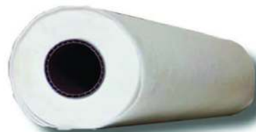
Reissverschluss selbstklebend Länge: 2.2 m Einzel oder in 20er-Karton Art. Nr. 321050/108