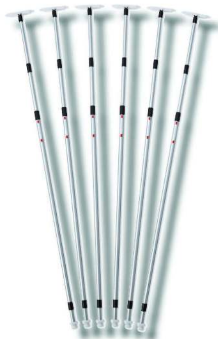
TP Teleskop- Trennwandstangen Länge: 1.7 m - 3.5 m 6 Stück in Tragtasche Art. Nr. 321050/110