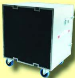
ToolPower TP 2200 Staubfänger-Luftreiniger Ventilator-Leistung: 2200 m 3 /h Art. Nr. 321050/11