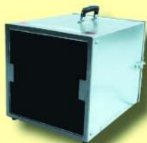
ToolPower TP 600 Staubfänger-Luftreiniger Ventilator-Leistung: 600 m 3 /h Art. Nr. 321050/12

Für mehrmaligen Gebrauch lohnt sich der Kauf. Für den einmaligen Einsatz mieten Sie den Luftreiniger und das Stangen-Set zu einem günstigen Preis.